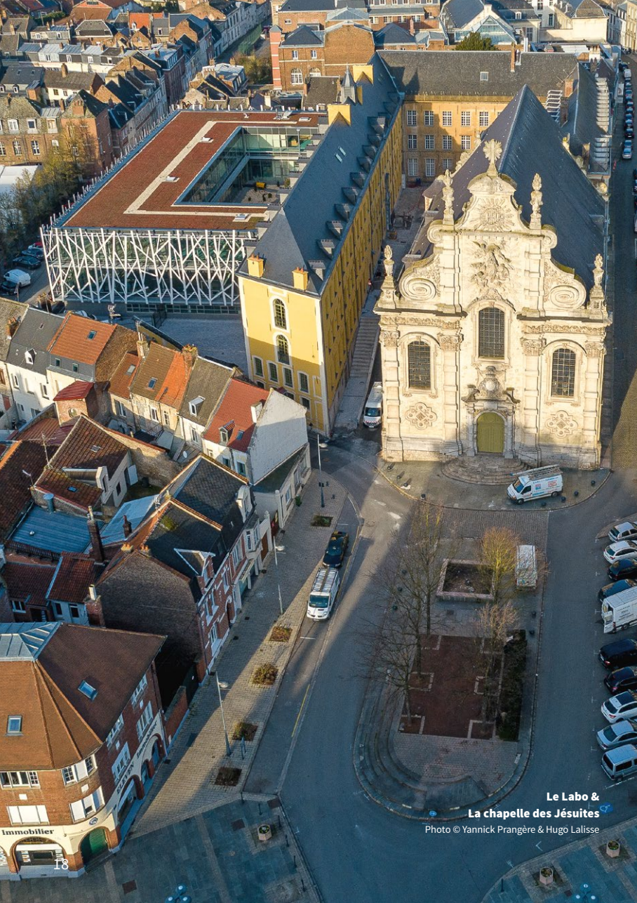
Le Labo & La chapelle des Jésuites